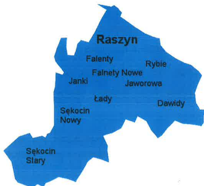
Mapa nr 1. Gmina Raszyn.

Gminy sąsiadujące z gminą Raszyn to Lesznowola, Michałowice, Nadarzyn, Warszawa.